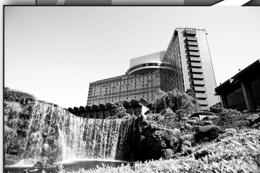
ホテルニューオータニ ザ・メイン